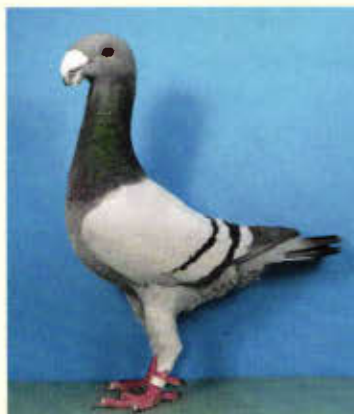
1,0 Deutsche Schautaube, blau mit schwarzen Binden (Andreas Tremel, Lichtenfels)