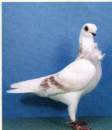
0,1 Italienisches Mövchen, rotfahl-schimmel (Michael Löffler, Buchbach)