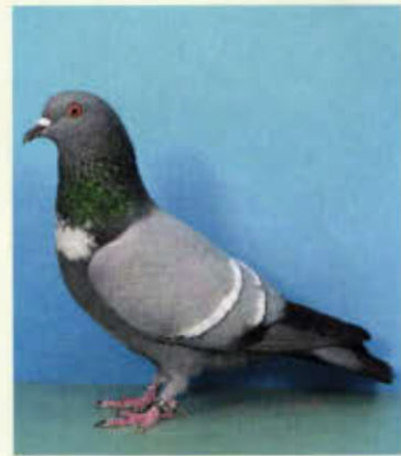
0,1 Startaube, Starhals, blau (Martin Rosenbaum, Hochstedt)