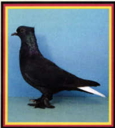
0,1 Aargauer Weißschwanz, schwarz (Frank Ruppel, Münster)