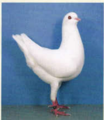
0,1 Deutscher Modeneser Schietti, weiß (ZG Ruff, Neudenu)