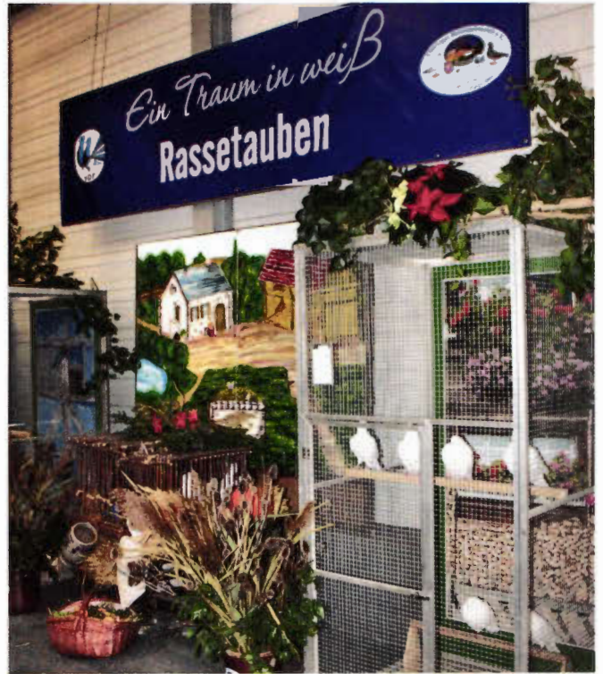
Tolle Präsentation von zehn verschiedenen Taubenrassen im Farbenschlag Weiß.

zung mussten die Aussteller mit ihrer Unterschrift bestätigen, dass die Tauben aus keinem Restriktionsgebiet (Sperr- oder Beobachtungsgebiet gemäß aktueller Geflügelpest-Verordnung) stammen. Kurz vor Eröffnung