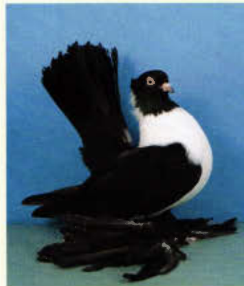
0,1 Rostower Positurtümmler, schwarz-weißbrüstig (Alexander Neuwirt, Möttingen)