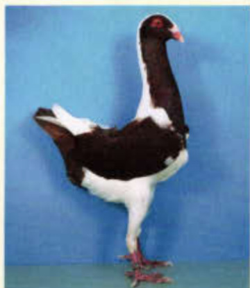
1,0 Huhnschecke, rot (Bernd Franz, Döbeln)