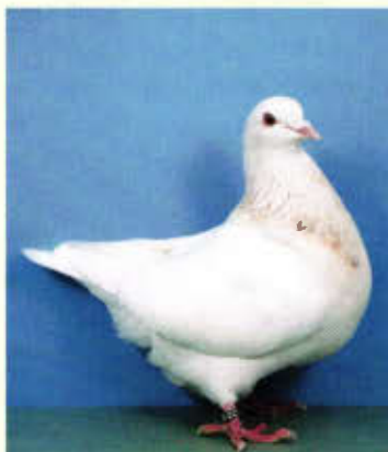
1,0 Texaner, kennfarbig hell, (Heiko Plank, Blaufelden)