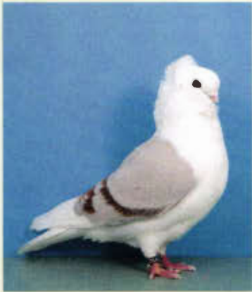
0,1 Altdeutsches Mövchen, rotfahl (Klaus Bongartz, Hürtgenwald)