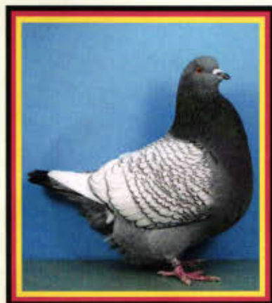
1,0 Luchstaube, weißschwingig, blau-weißgeschuppt (Rudolf Plendl, Eichendorf)