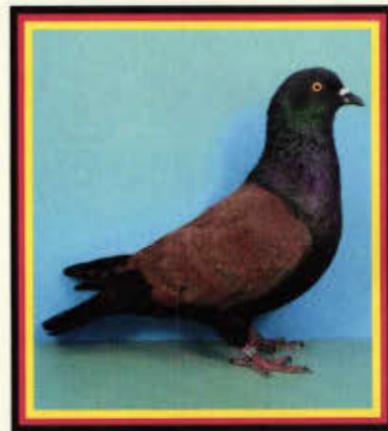
1,0 Thüringer Goldkäfertaube (Helmut Büchner, Ichttershausen)