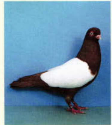
0,1 Wiener Weißschild, rot (Heinz Kratzenberg, Bielefeld)