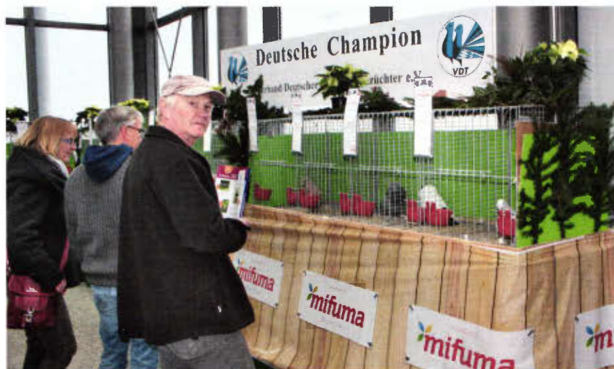
Die Champions und Champion-Anwärter zogen viele Blicke auf sich.