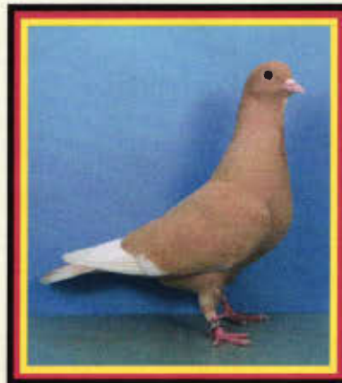
0,1 Arabische Trommeltaube, dominant gelb (Siegfried Felter, Essen)