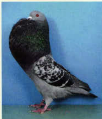
1,0 Hessischer Kröpfer, blaugehämmert (Norbert Riebling, Straußfurt)