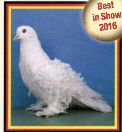
1,0 Lockentaube, weiß (Richard Moser, München)