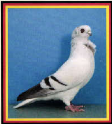
0,1 Hamburger Sticke, lichtblau mit schwarzen Binden (Rainer Dammers, Bad Bramstedt)