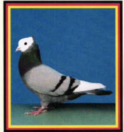
1,0 Rheinischer Ringschläger, blau mit schwarzen Binden (Hubertus Wiegand, Fulda)