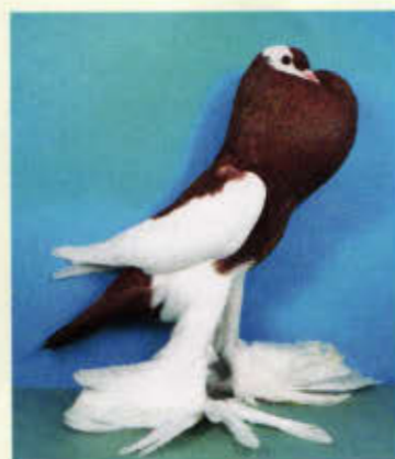
0,1 Verkehrtflügelkröpfer, rot (Rolf Müllerleile, Rheinhausen)