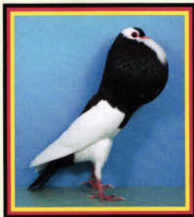
0,1 Stellerkröpfer, schwarz- geanselt (Johann Kingl, Neuburg)