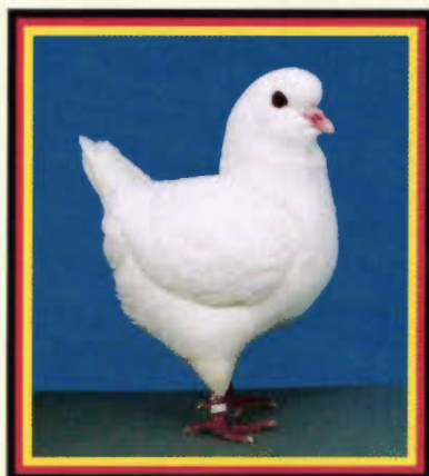
0,1 Kingtaube, weiß (Bernhard Fink, Simbach)