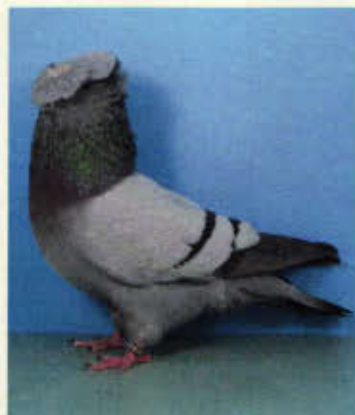
0,1 Fränkische Trommeltaube, blau mit schwarzen Binden (Hermann Wirth, Stammbach)