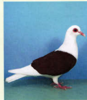
1,0 Fränkische Samtschild- taube, rot (Uwe Leuschner, Toddin)