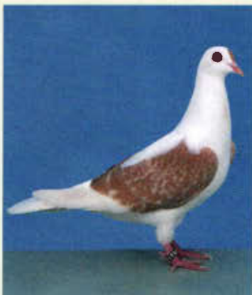
0,1 Thüringer Flügeltaube, gelbfahl-gehämmert (Helmut Gack, Grub am Forst)