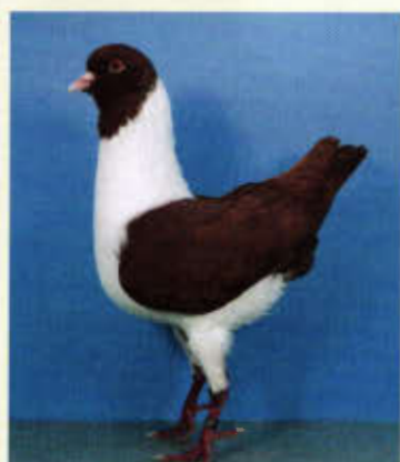
1,0 Deutscher Modeneser Gazzi, rot (Sebastian Ortkras, Beelen)