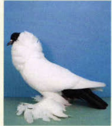
0,1 Schmalkaldener Mohrenkopf, schwarz (Bernd Franz, Döbeln)