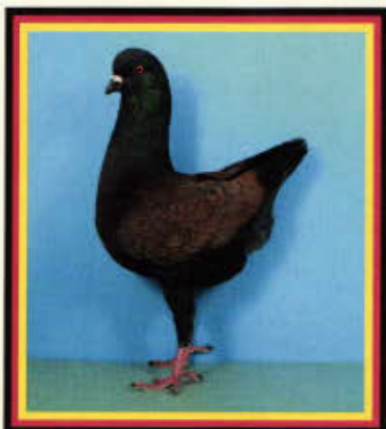
1,0 Deutscher Modeneser Schietti, dunkel-bronzeschildiggesäumt (Uwe Weiß, Neuensalz)