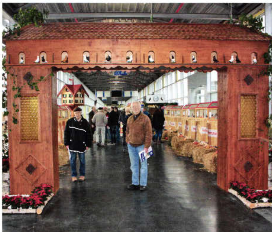
Dieses schmucke Torbogen-Taubenhaus empfing die Besucher der VDT-Schau.

Ausrichter Thüringer Rassetaubenclub, neues VDT-Vorstandsteam und Veterinäramt ermöglichten tolle Präsentation von 22.500 Tieren