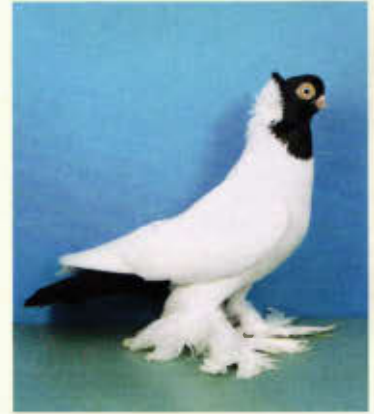
0,1 Königsberger Farbenkopf mit Haube, belatscht, schwarz (Harald Lindner, Salzgitter)