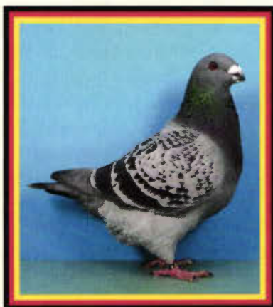
1,0 Giant Homer, blauehämmert (ZG Römer, Riesdorf)