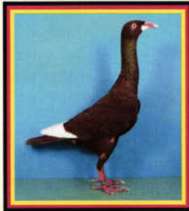
0,1 Deutscher Langschnäbliger Tümmler, Bärtchen, rot (Paul Wöllner, Eichigt)