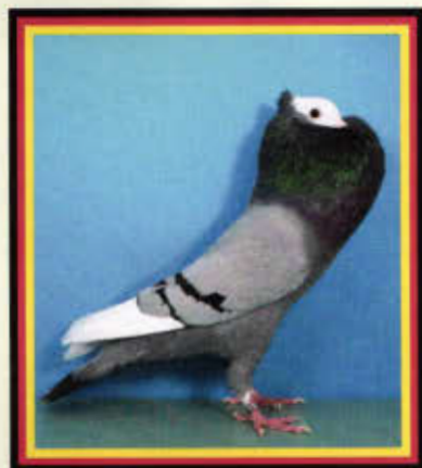
1,0 Thüringer Kröpfer, blau mit schwarzen Binden gemöncht (Sven Löbnitz, Isserstedt)