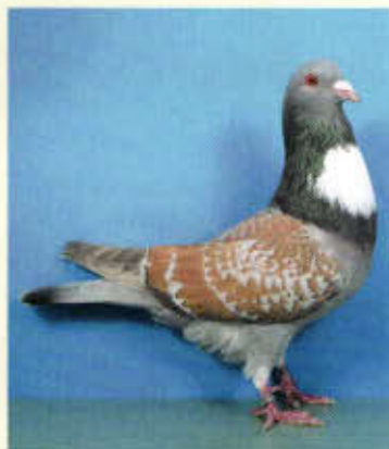
1,0 Cauchois, blaufahl-sulfurgeschuppt (Helmut Trinkerl, Ebern)