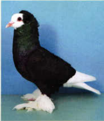
1,0 Süddeutsche Mönchtaube, belatscht, schwarz (Wolfgang Menger, Groß-Rohrheim)