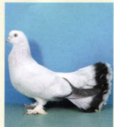
1,0 Seldschuke, eisfarbig ohne Binden (Hartmut Döppert, Creglingen)