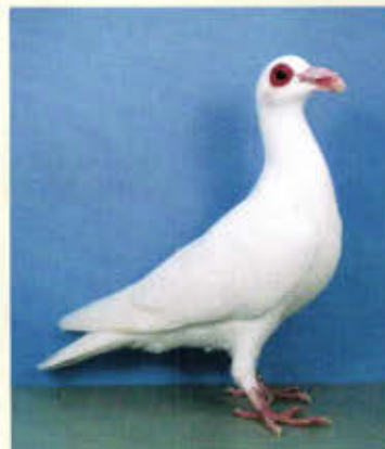
0,1 Steinheimer Bagdette, weiß (Armin Gesser, Alzenau)